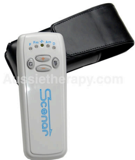
専用革ケース付き