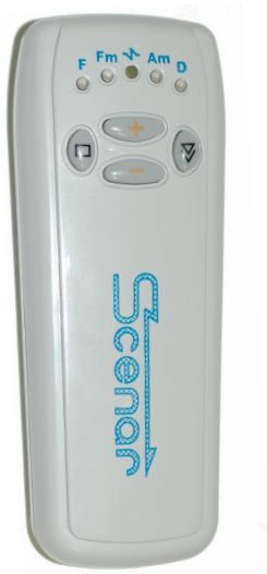
スクエナー操作面