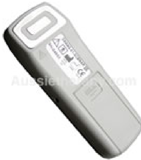
スクエナー電極面